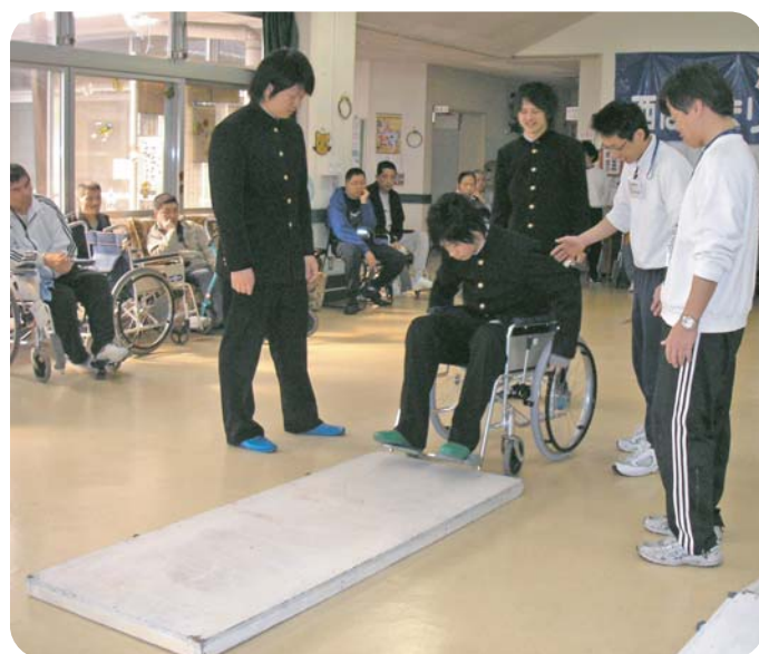
生徒さん 段差を車いす体験中です

2月7日（水）姫路市にある県立飾磨工業高等学校健康科学工学科の生徒さんと当施設利用者の皆さんで、「車いすスロープ」の寄贈式典を行いました。6名の生徒さんが式典に参加してくださいました。スロープは、課題研究で製作されたもので当施設の中庭にある相談室と建物の間にあった段差部分に設置しました。